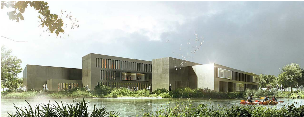
Esquisse du bâtiment vu depuis les berges de l'III (© W-Architectures)

C'est le cabinet W-Architectures qui a été retenu par le jury, fort de plusieurs réalisations d'équipements culturels tels que les réserves du Musée Ingres à Montauban (82) ou l'accueil du Pôle International de la Préhistoire aux Eyzies-de-Tayac (24). L'équipe qui travaille sur le projet est conduite par l'architecte Raphaël Voinchet.