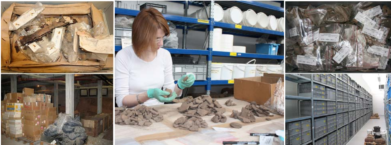
Aperçu "avant/après" d'un chantier de collection

Depuis 2009, le PAIR et les services de l'État organisent un vaste chantier des collections, c'est-à-dire la reprise des objets issus d'opérations anciennes (inventaire informatique, conditionnement, veille climatique) en vue de leur harmonisation et de leur intégration dans le CCE. Plus de 200 m 3 de collections ont été traités à ce jour, des objets et des vestiges de la Préhistoire à l'époque Contemporaine découverts dans tous les territoires de la région.